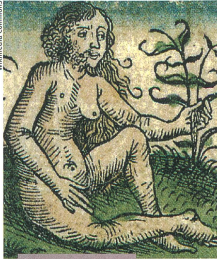
Kultur und Gesellschaft