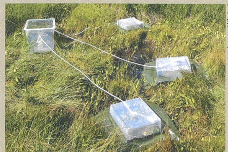
Schwefelfalle: Versuchsaufbau an der Gola di Lago im Tessin.