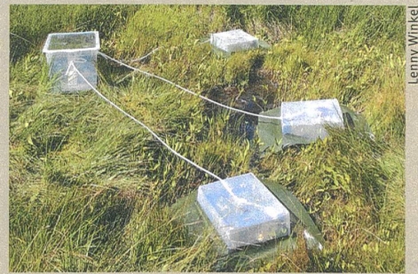
Schwefelfalle: Versuchsaufbau an der Gola di Lago im Tessin.