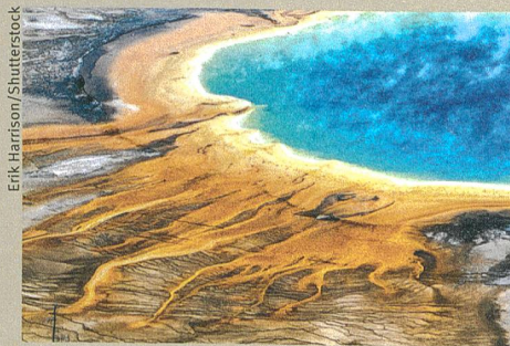
Wo einst ein Supervulkan ausbrach, hat sich ein kleiner See gebildet (Yellowstone Nationalpark).

W.J. Malfait et al. (2014): Supervolcano eruptions driven by melt buoyancy in large silicic magma chambers. Nature Geoscience 7, 122–125.