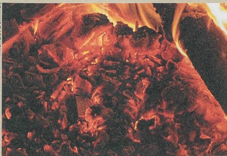
Selbst kleinste Rückstände von verbranntem Holz sind aufschlussreich.