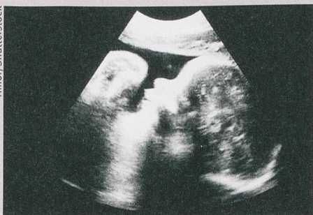
Ein siebenmonatiger Fötus, der hoffentlich ohne gestörte Bindungsbeziehung zur Welt kommt.