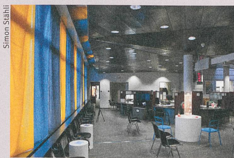
Diskret, nicht aufdringlich: Umgestaltete Besucherräume der Einwohnerdienste der Stadt Bern.