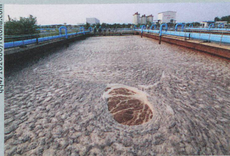
In verdünntem Klärschlamm wachsen Antibiotika-resistente Bakterien besonders gut.

B. Ricken et al.: Degradation of sulfonamide antibiotics by Microbacterium sp. strain BR1 – elucidating the downstream pathway. New Biotechnology (2015)