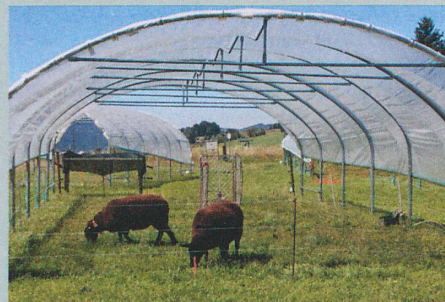
Mit dem Gewächshaustunnel simulierten die Forscher einen sehr trockenen Sommer.

C. Deléglise et al.: Drought-induced shifts in plants traits, yields and nutritive value under realistic grazing and mowing managements in a mountain grassland. Agriculture, Ecosystems & Environment (2015)