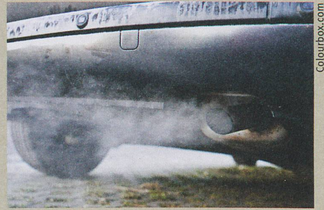
Das Ziel: weniger Russ in den Abgasen.