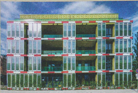
Die Algen im Hamburger BIQ-Haus produzieren Biomasse und inspirieren Forschende.