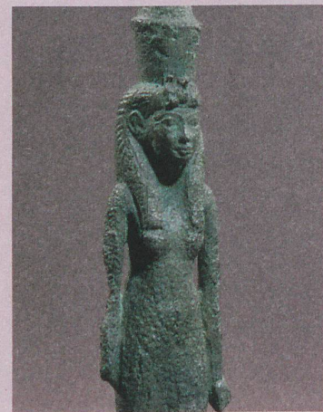
Hier ist sie ein Mensch. Doch Mut erscheint manchmal auch als Geier.