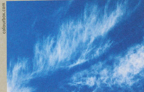
Zirren wirken wie mit feinen Pinselstrichen gemalt. Ihr Einfluss aufs Klima ist aber beachtlich.