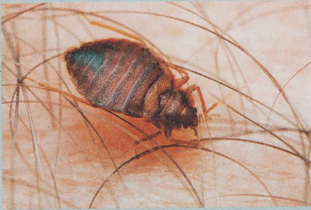
Ungemütliche Bettgenossen: Die Blutsauger werden immer resistenter gegen Insektizide.