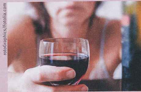
Manchmal erfolgt der Griff zum Glas aus Langeweile.