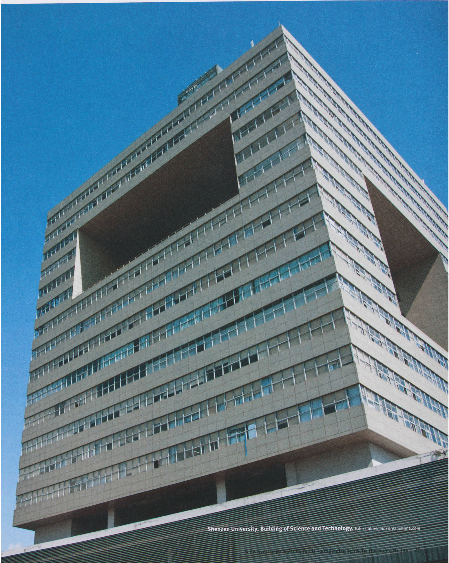
Shenzhen University, Building of Science and Technology.