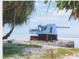
Noch können die Menschen auf dem Tawara-Atoll von Kiribati wohnen (links) und unbeschwert Fussball spielen (oben). Wenn der Meeresspiegel aber weiter ansteigt, wird die Sprache ein dauerhafteres Überbleibsel der Kolonialherrschaft sein als die Kanone (unten).