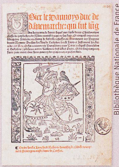
Französische Texte waren im 15. Jahrhundert gefragt. Dies führte zur Erfindung des Ritterromans.

A. Franc: Early origins of Fair Trade: From the United Nations Conference on Trade and Development 1964 to the Tanzanian instant coffee campaign 1973–75 (in preparation)