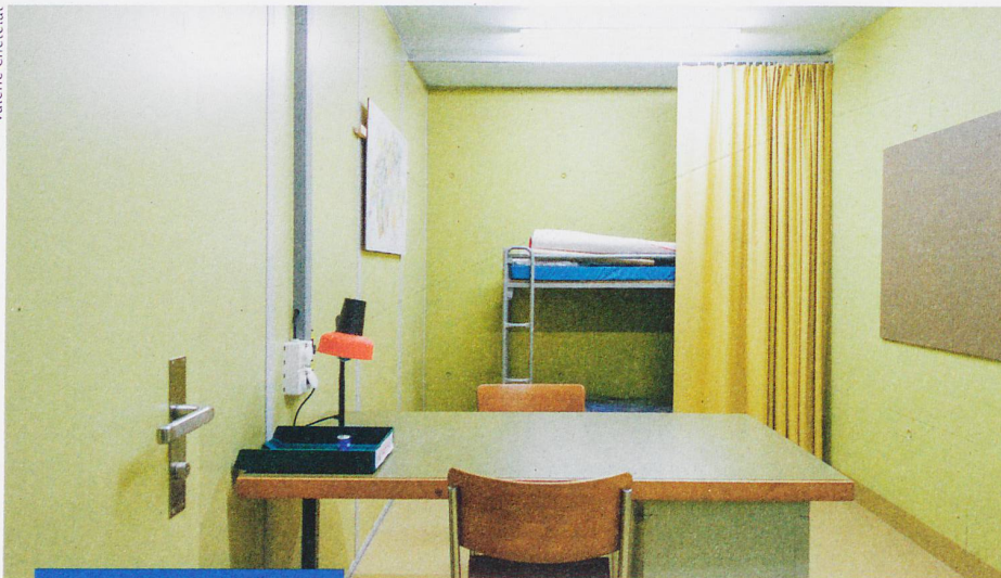
Schwerpunkt Im Untergrund