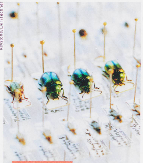
Wissen und Politik