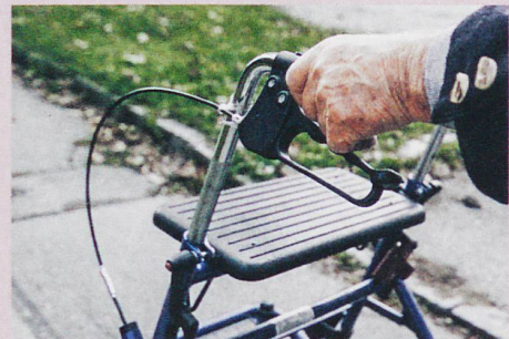
Manche Senioren lehnen den Rollator ab, weil sie dem Bild der fitten Alten entsprechen wollen.

F. Rickli: Old, disabled, successful? Transfigurations of aging with disabilities in Switzerland. In: Medical Anthropology Theory (in preparation).