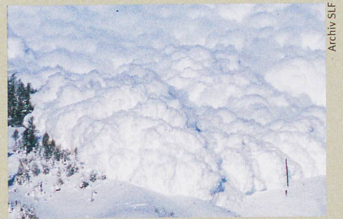
Arbaz im Wallis: Ein neues Radargerät durchschaut künstliche Staublawinen.