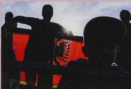
Je stärker sich die kosovo-albanische Minderheit mit der Schweiz identifiziert, desto weniger engagiert sie sich für die eigene Ethnie.

A. Giroud: Dual identities, intergroup contact, and political activism among minorities: The case of Bulgarian Roma and Kosovo Albanians in Switzerland. Doctoral thesis (2019)