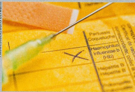
Impfungen: Bei Neugeborenen weniger wirksam.