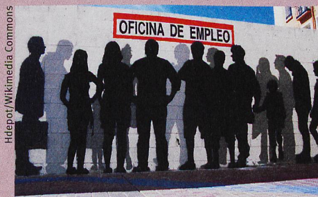
Ein Graffiti im spanischen Zaragoza thematisiert die Arbeitslosigkeit im Land.

M. Vacchiano et al.: The family as (one- or two-step) social capital: mechanisms of support during labor market transitions. Community, Work and Family (2019)