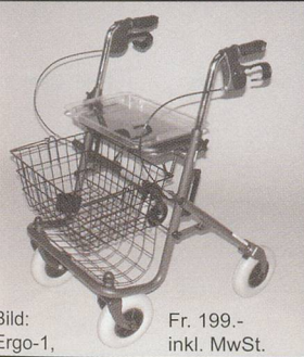
Bild: Ergo-1, Fr. 199.- inkl. MwSt.

Machen Sie den Preisvergleich.. es lohnt sich!