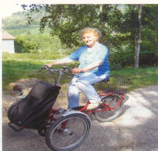
Shoppi auch mit Motor lieferbar!