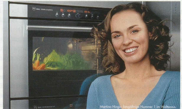
Martina Hingis: langjährige Nummer 1 im Weltennis.

Mein Lieblingsdoppel: Combi-Steam und Microbraun.