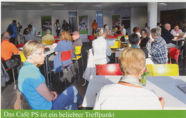
Das Café PS ist ein beliebter Treffpunkt