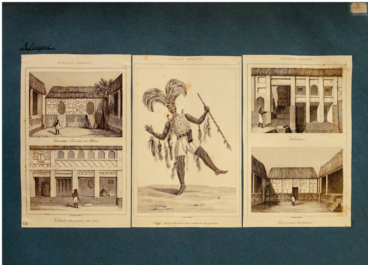
Fig. 5. Planche illustrant des architectures et costumes de l'Afrique Achantis tirées de M.F. Hofer, Afrique australe... tome 5 ( L'univers pittoresque ), gravures sur acier, dans Histoire de l'Ornement – Collection Hermann Hammann , tome 10, planche 5.