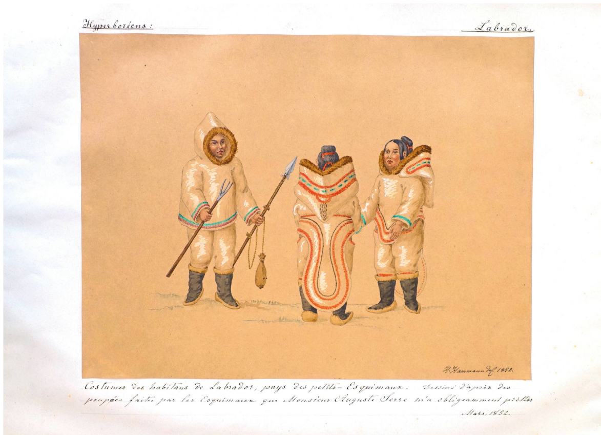
Fig. 3. Hermann Hammann, Costumes des habitants du Labrador, crayon, encre et aquarelle, 1852, dans Histoire de l'Ornement – Collection Hermann Hammann , tome 1.2, planche 12 © BAA.