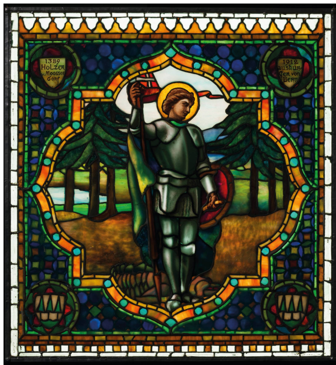
Abb. 4 und 5. Jakob Adolf Holzer, Der Sämänn und Der heilige Georg mit dem Drachen , um 1912, Vitromusée Romont, Depositum Kirchgemeinde Moosseedorf, VMR 434a und VMR 434b.