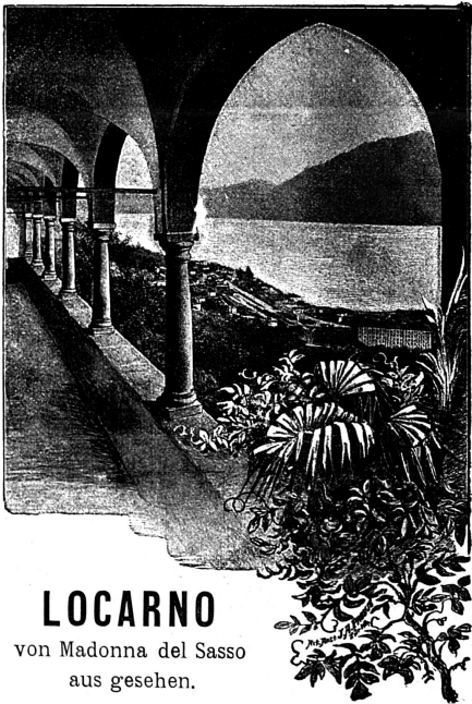
LOCARNO von Madonna del Sasso aus gesehen.

Klingt es nicht wie Hohn, wenn man unter der Abbildung rechts liest: „Locarno von Madonna del Sasso aus gesehen.“ Sollte es nicht eher heissen: „Locarno bei Nacht?“ Nein; denn auch diese Bezeichnung klinge noch höhnisch, weil Locarno sogar bei Nacht schöner ist, als Figura zeigt. Kaum dass man die Säulen des Wandelganges des Minoritenklosters Madonna del Sasso auf der Zeichnung unterscheidet, abgesehen davon, dass das Cliché allein einen Raum von ca. 80 Petitzeilen à 20—25 Ct. die Zeile umfasst. Unsere inserierenden Leser mögen diese Auseinander-