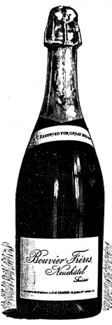
Se trouve dans tous les bons Hôtels suisses.

Premier Sommelier . Pour un bon Hôtel au bord du Léman bien fréquenté par les voyageurs de commerce et des passants on demande un jeune homme actif sérieux et de toute confiance, il doit avoir occupé des places semblables et connaître l'anglais. S'adresser par écrit avec photographie et certificats à l'Expedition del' „Hôtel-Revue“ sous Chiffre 950 .