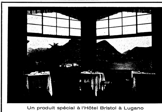
Un produit spécial à l'Hôtel Bristol à Lugano