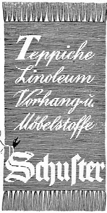
Teppichhaus St. Gallen Zürich

Unsere Einnahmen- und Ausgabenbücher (Rekapitulation)