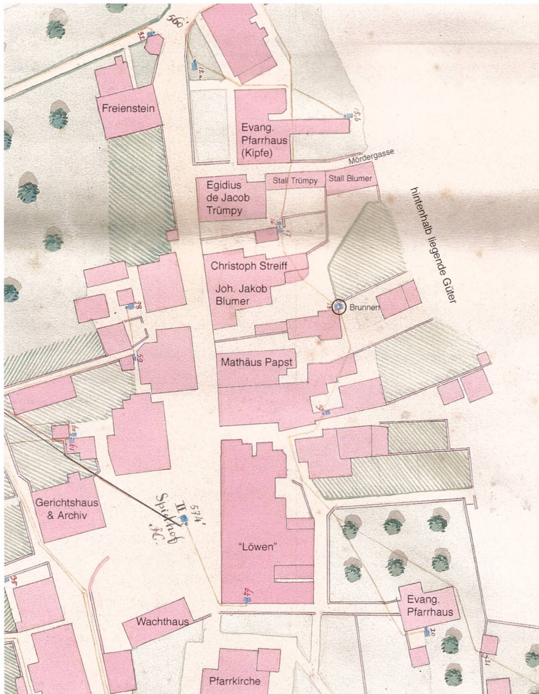
Der alte Spielhof von 1860 mit Blumers Haus, Stall und Brunnen. Ausschnitt aus dem Brunnenplan der Gemeinde Glarus, 2tes Blatt, 1860, von Fridolin Vogel, nach einer Vorlage Linthingenieur G. H. Leglers von 1852. Bearbeitung durch August Berlinger. (GAG)