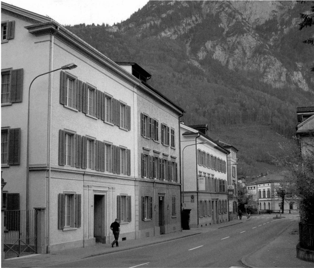
Häuserzeile mit den nach dem Brand neu erstellten Häusern, im Vordergrund das Haus Streiff / Blumer.