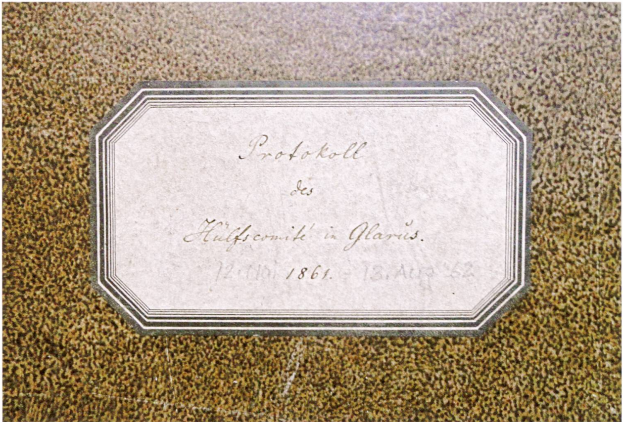
Einbandbeschriftung des Protokollbuches.