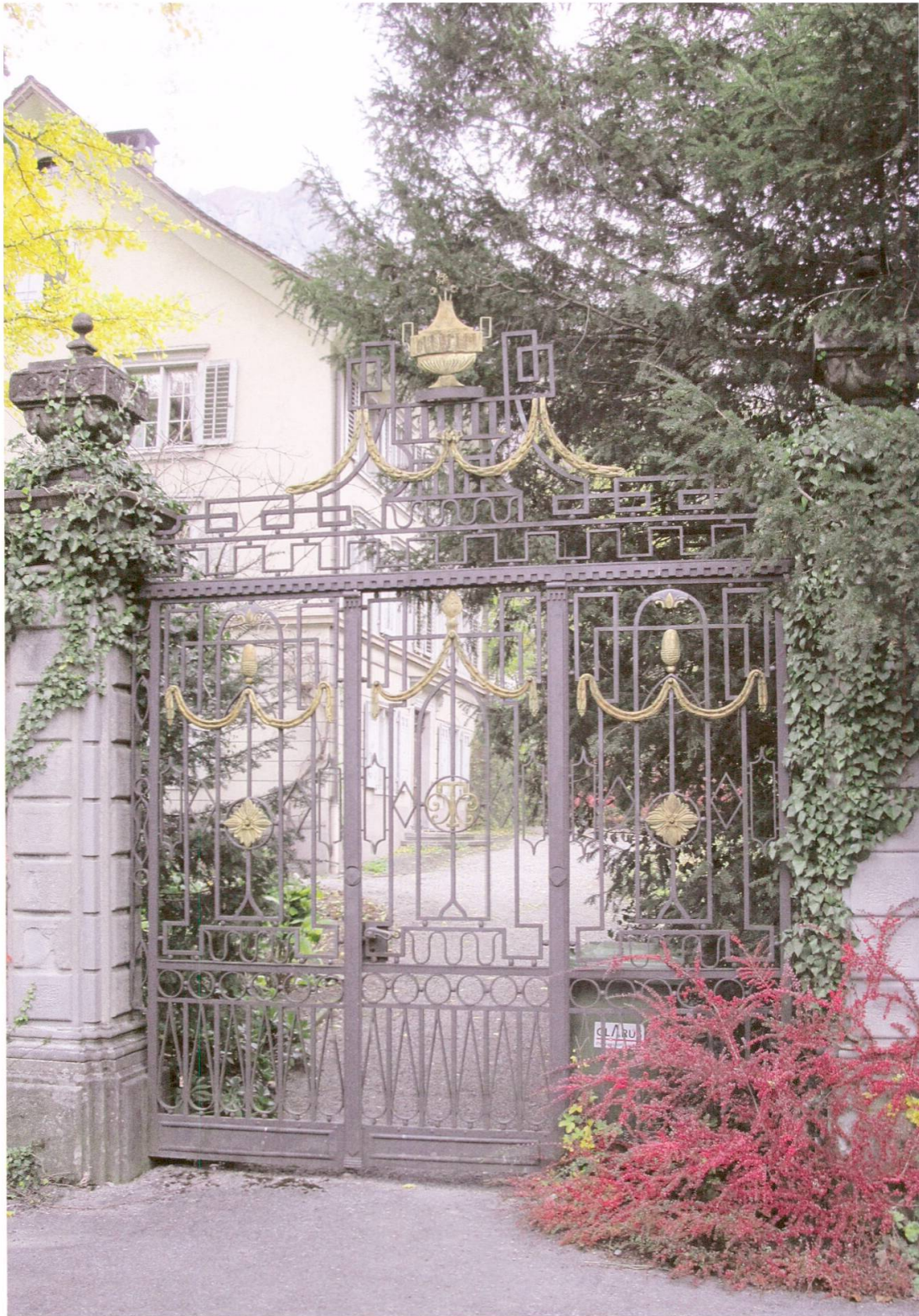
Das ehemalige östliche Gartentor des 1861 abgebrannten Tschudihofes.