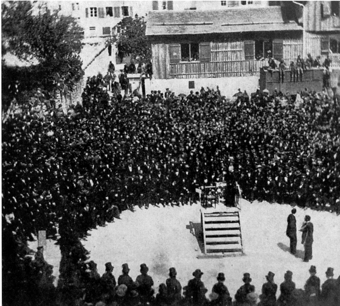
Die Landsgemeinde in einer verschollenen Aufnahme von 1861. Sie fällt schon im 19. Jahrhundert überraschende Entscheide, allerdings nicht immer auf demokratisch einwandfreie Art. (Nachdruck nach Winteler, Glarus, 1961)

verhielt sich die Mehrheit der Bevölkerung, die in der Mitte des Jahrhunderts noch nicht zur Fabrikarbeiterschaft zählte? Wie ist die Tatsache einzuschätzen, dass die Landsgemeinden von 1864 und 1872 tumultuös und undemokratisch verliefen? Warum warfen die drei ersten Fabrikinspektoren nach Ablauf der Amtszeit alle das Handtuch?