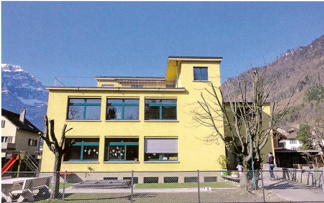
Kinderkrippe Ennenda von Architekt Hans Leuzinger, 1931. Kubische Formen in Stahl und Glas ersetzen im 20. Jahrhundert traditionelle Fenster-, Mauer- und Dachformen (als Kontrast: Kleinkinderschule Ennetbühls von Hans Leuzinger, 1919).

beständiger Erweiterung erhalten werden und trägt zur Identifikation der Bevölkerung mit «ihrer» Baukultur bei. Im Kanton Glarus finden denkmalpflegerische und archäologische Baubegleitungen vergleichsweise selten statt. Umso wichtiger ist der verantwortungsvolle Umgang mit historischer Bausubstanz und Landschaft durch die Eigentümer und die Behörden, über das gesetzliche Minimum hinaus.