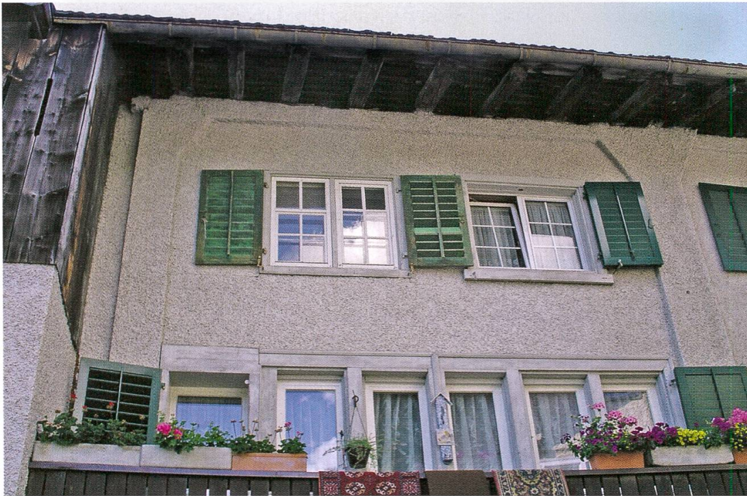
Ständer-Bohlen-Konstruktion des 15./16. Jahrhunderts in Ennetbühls. Das Wandgerüst aus senkrechten Ständern reicht über zwei Geschosse und zeichnet sich in der verputzten Fläche ab. Die dreieckartigen Kopfstreben der Ständer sind sog. angeblattet.

Im Laufe des 18. Jahrhunderts gewann die Textilindustrie an Bedeutung. Zuerst wurde die Produktion in den Wohnhäusern der Familien untergebracht, die sich dadurch zusätzliche Einkommen erwirtschafteten. Damit wurden Wohnbauten in den wachsenden Dörfern zu gewerblichen Zwecken umgenutzt – und später wieder der Wohnfunktion zugewiesen. Deshalb ist diese Etappe der Wirtschaftsgeschichte mit Verlagswesen und Manufakturen heute kaum mehr sichtbar. Auch eine klare Einteilung der Bauten nach ihrer Funktion wird dadurch schwierig; man spricht deshalb von Bauaufgabe und sekundären Nutzungen.