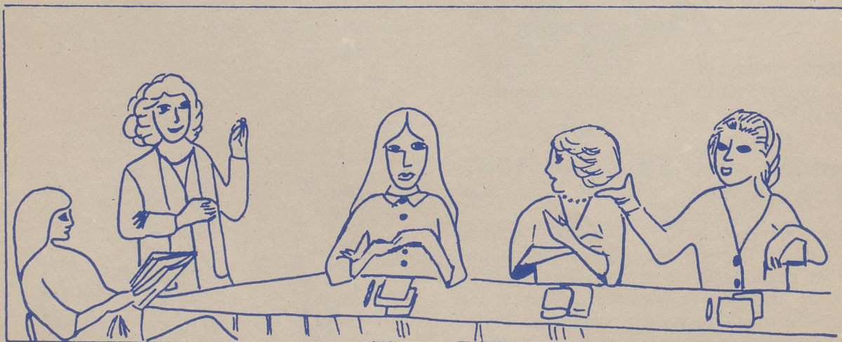
dessin Christine Barré

Très longtemps, on a pensé que les régions pauvres et périphériques étaient condamnées à vivre dans l'ombre des régions riches et industrielles. La restructuration industrielle et l'avènement d'industries dites de pointe donnent une chance aux petites et moyennes entreprises et aux régions périphériques d'échapper enfin au déterminisme économique et cela d'autant plus que ces régions (l'Arc horloger en particulier) ont des atouts sérieux dans leur jeu : qualification du personnel, facilité d'adaptation, esprit d'entreprise... Ces atouts doivent cependant être mis en valeur en particulier par un développement de la formation professionnelle et par une intervention conjointe des pouvoirs