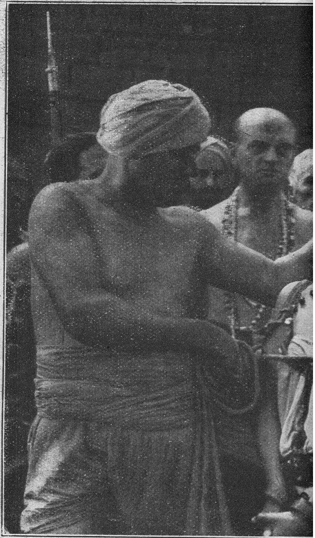
Szenenbild aus „Der heilige Hass“