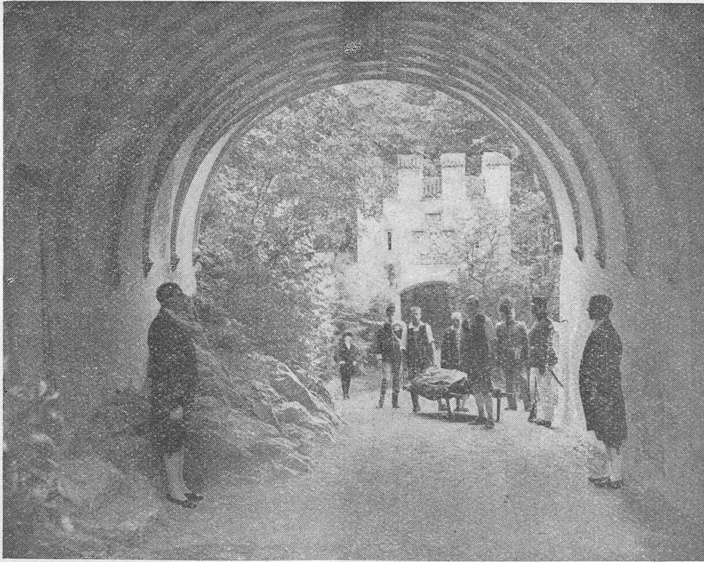
Szenenbild aus dem Großfilm „Königsmark“