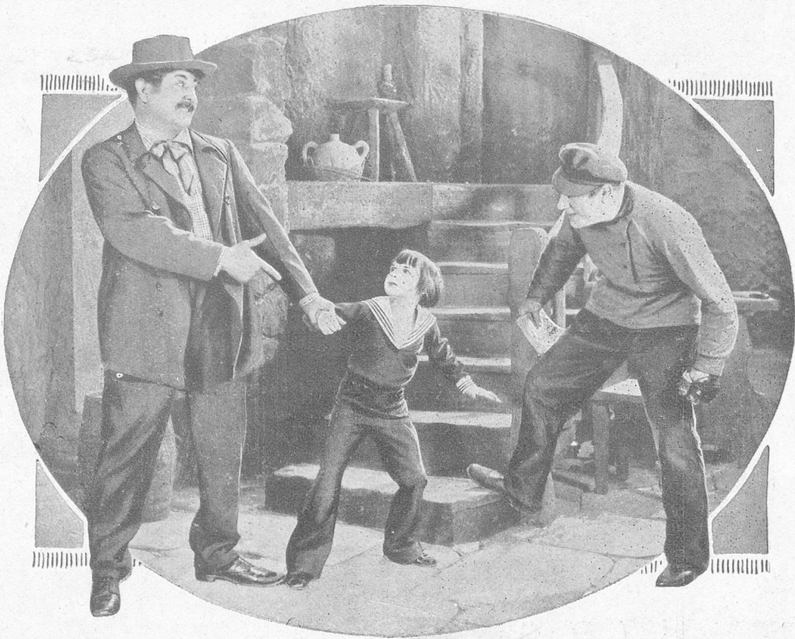
Jackie Coogan in seinem neuesten Film «Der kleine König».