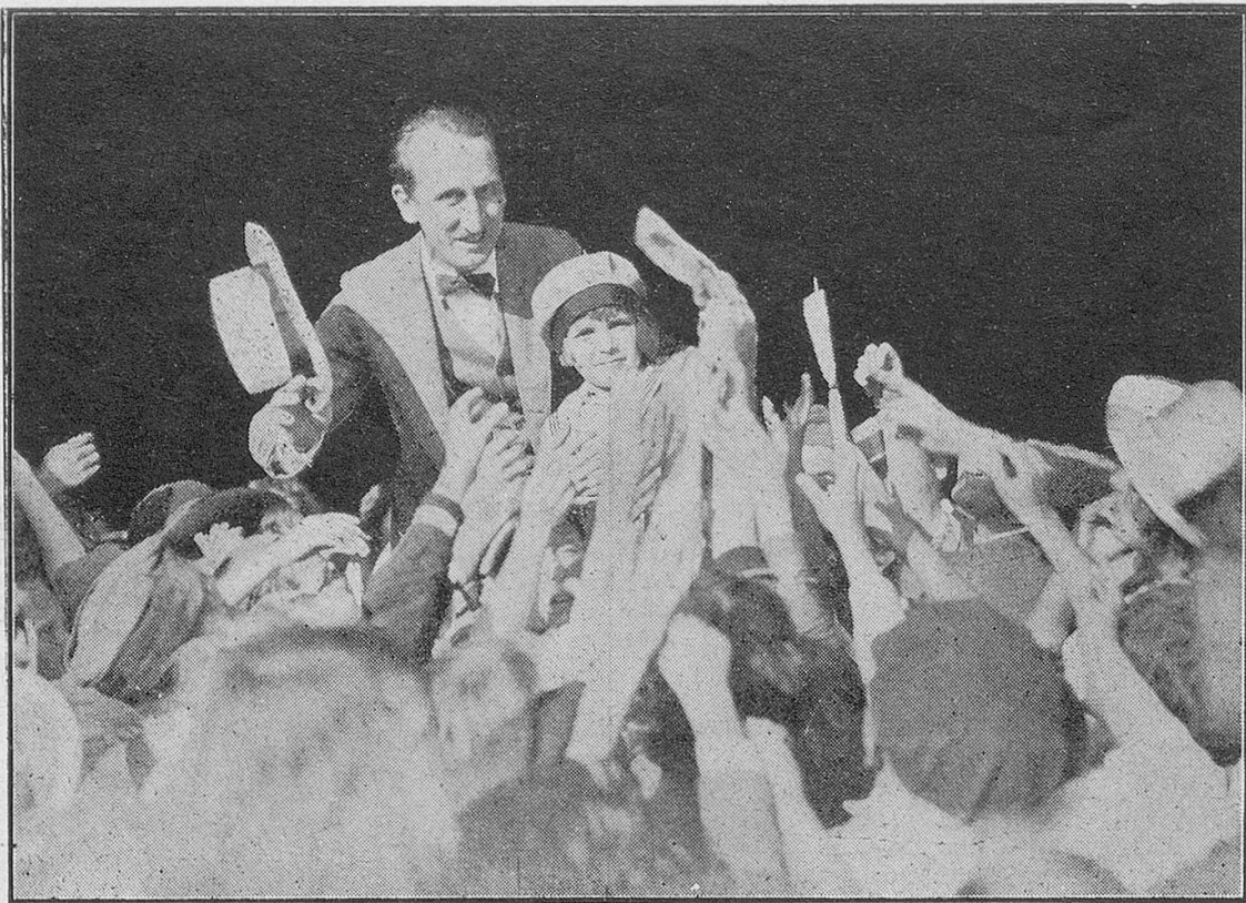
Die Ankunft Jackie's in London.