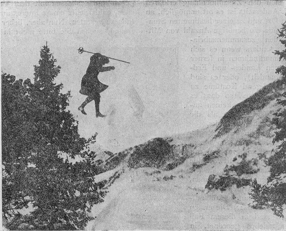
Szenenbild « Auf gefährlichen Spuren »