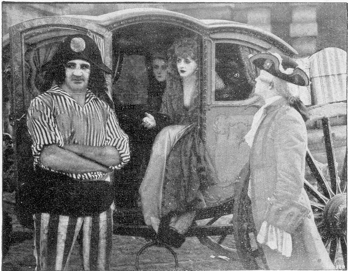
Szenenbild aus dem Rex Ingram-Film « Scaramouche »