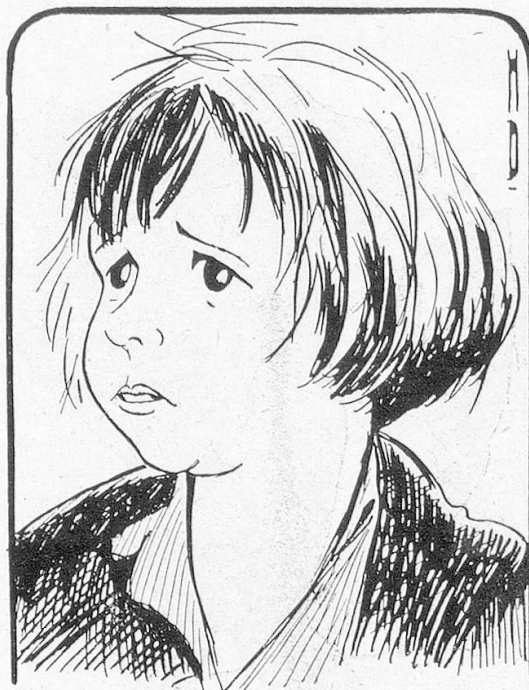
Auch der jüngste Filmstar ist nicht gegen Karikaturen gefeit: JACKIE COOGAN

Unzählig sind die Karikaturen, die sich mit der Filmwelt und ihre hauptsächlichsten Repräsentanten, dem Filmstar, befassen. Wir geben heute eine kleine Auslese, die in treffender Weise das Charakteristischste jeden Künstlers wiedergibt.