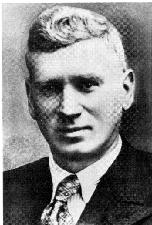
Bildhauer Adolf Riss, Vater (1893–1949) von Altstätten

Damit erhielt das Denkmal eine Grösse von 2,5 m Höhe und 2,05 m Breite.