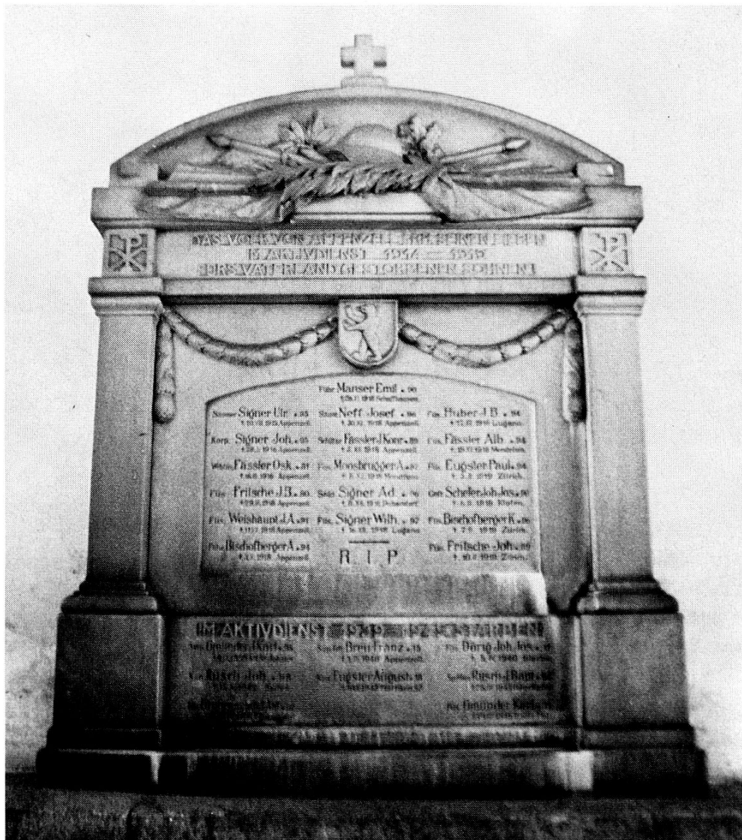
Heutiges Soldatendenkmal (1980)