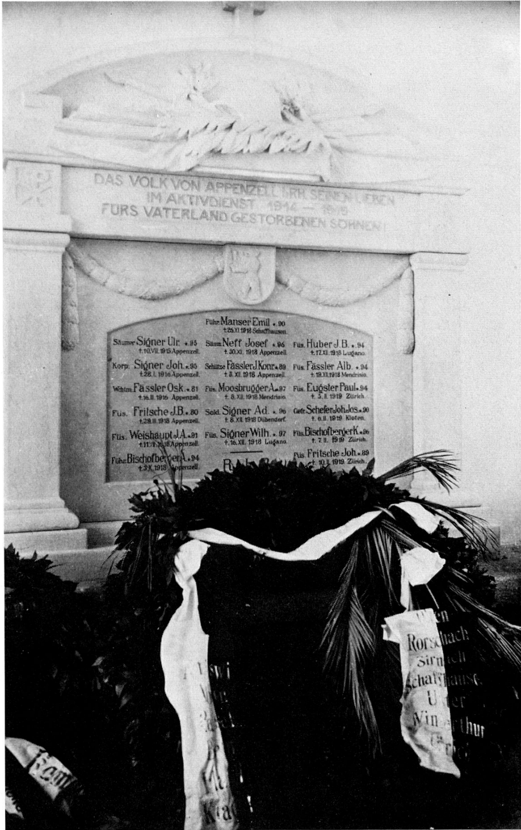
Soldaten-Denkmal am 25. März 1925 mit dem Kranz der auswärtigen Appenzellervereine