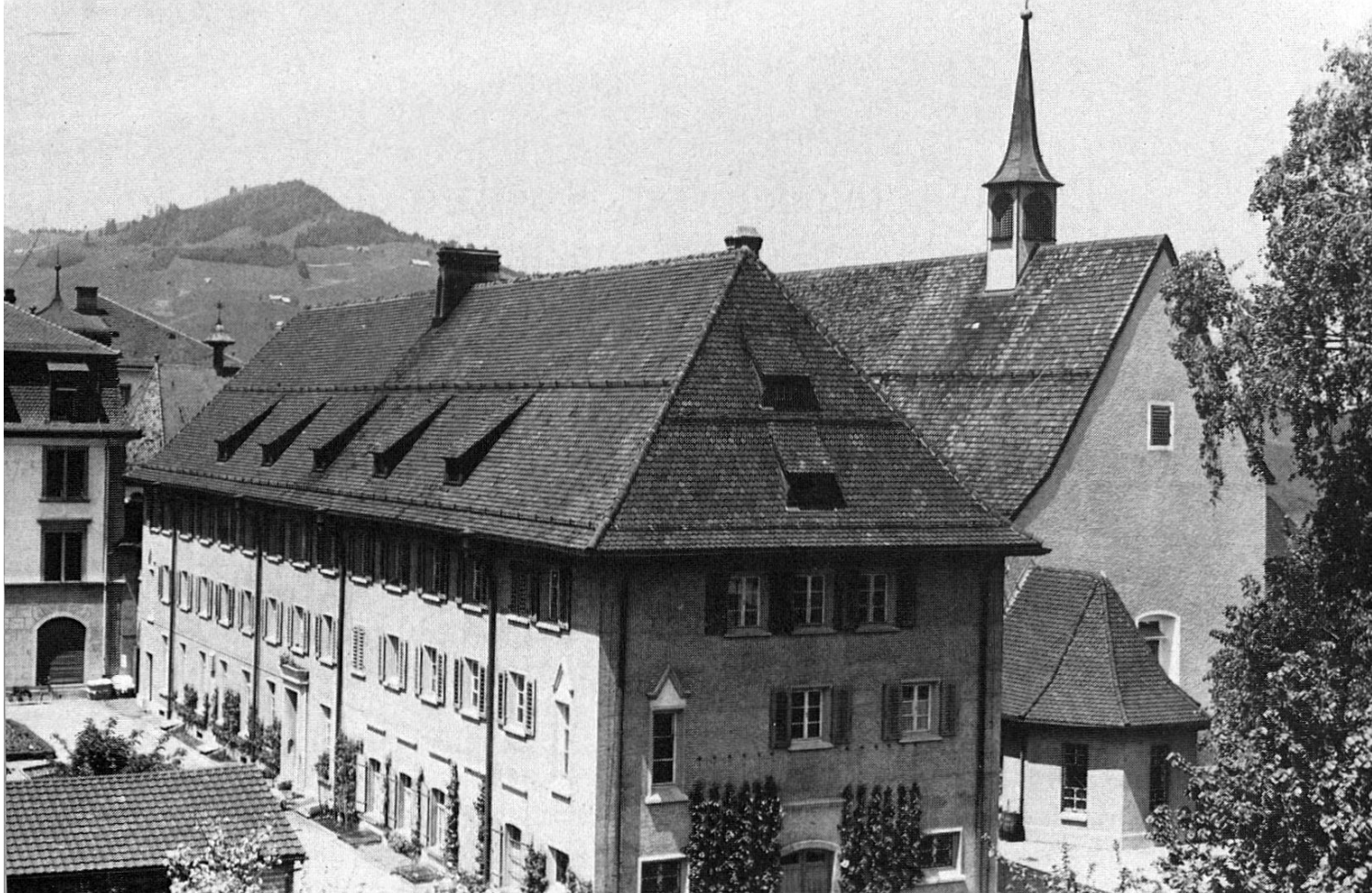
Das Provisorium wurde 1925/26 durch den mehrstöckigen Neubau von Wintelzer/Burkard ersetzt.

1959/60 wurde auch das Dachgeschoss zu einem Zellentrakt ausgebaut.