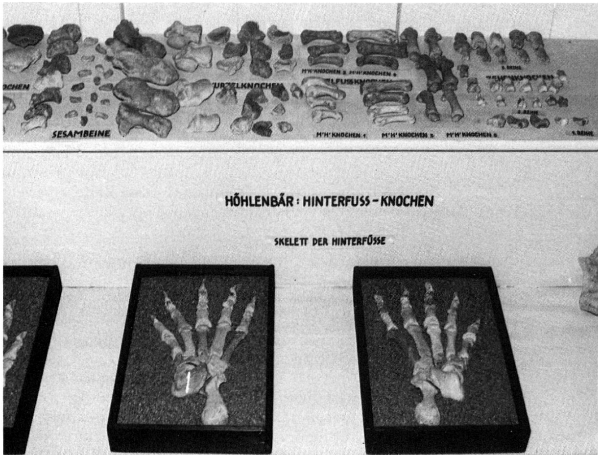
Ausschnitt aus der Wildkirchlisammlung.