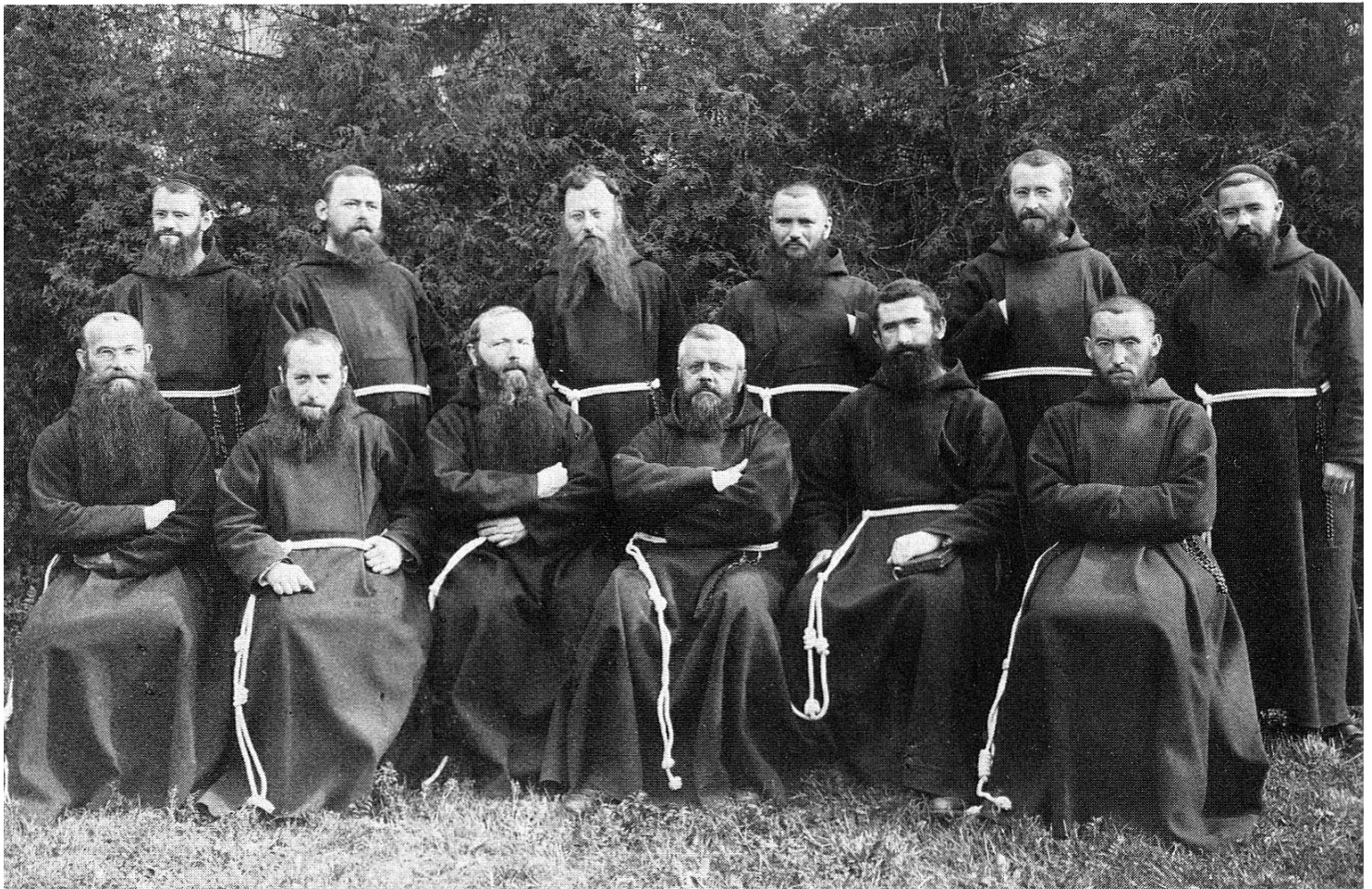
Ein Teil der Klosterfamilie Appenzell 1912 – 1915

In dieser prekären Lage waren private Initiative und Opferbereitschaft unentbehrlich. Nur so vermochte sich das Primar- und Real- schulwesen im ausgehenden 19. Jahrhundert den gesteigerten Ansprü- chen zu stellen. Das gilt in vermehrtem Masse für höhere Bildungs- schulen, die unter den gegebenen Umständen dem Kanton einfach nicht zugemutet werden konnten.