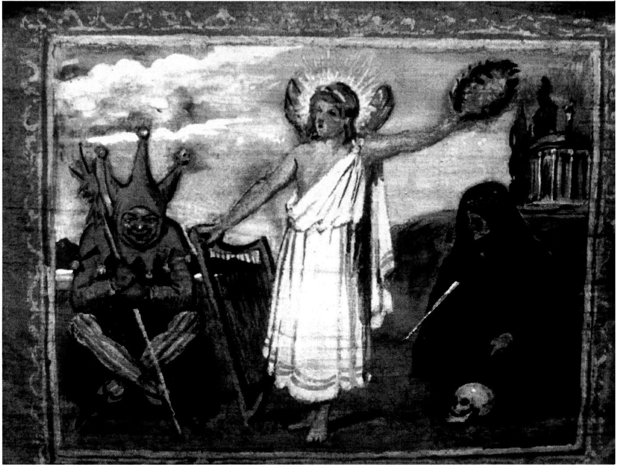
Die allegorische Miniatur auf dem Hauptvorhang mit Narr, Muse (?) und Vanitas.

stenbühne – und der Illusion! – indem er schmunzelnd hinter den Vorhang blickte oder aus den Theatergeheimnissen zu plaudern begann. Ein Prachtsbeispiel ist der Prolog zu «Waldkönig Laurin». Hier erkundigt sich der Theaterdirektor, weshalb der Vorhang noch nicht geöffnet worden sei, worauf sich der Kasper laut beklagt, er sei noch im Hemd. Hierauf hält ihm der Direktor entgegen, er sei wohl wieder verspätet aus der Kneipe gekommen.