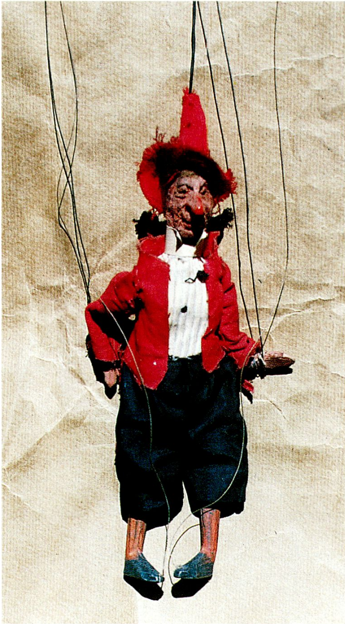
Kasperl Larifari (vermutlich aus der Hand Victor Toblers)

Zum Repertoire gehörten, nach den Handzetteln und Plakaten sowie weiterer Theaternotizen zu schliessen, auch die folgenden Stücke: «Wolfsschlucht», «Freischütz», «Samiel erscheint im Feuer», «Der verzauberte Prinz» u.a.