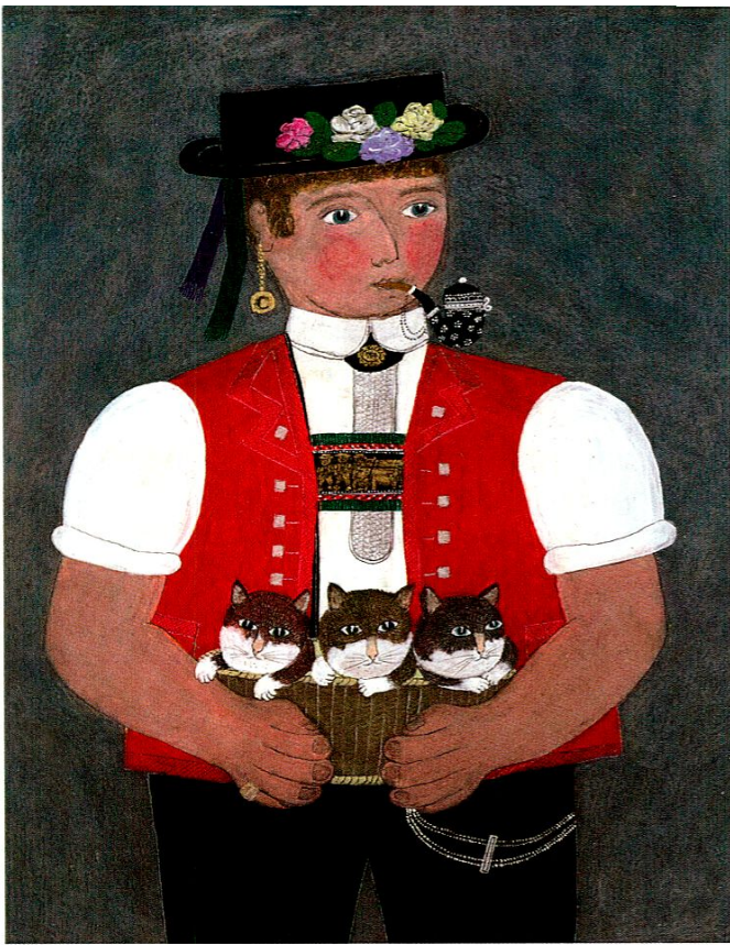
Verena Broger: Bauer mit Katzen, o.J., Mischtechnik.

naive Geschichten aus einer hügeligen Welt. In ihren Bildern gestaltet Verena Broger unsere Sehnsüchte und unsere inneren Bilder von Gemächlichkeit, Lebenslust und Harmonie. Es sind keine lauten Bilder, in ihnen ist verhaltene Freude gestaltet – typisch appenzellische Zurückhaltung. Erst beim genaueren Betrachten entdeckt man da und dort einen doppelbödigen Witz. Die Farbigkeit der Bilder offenbart einen klaren Wandel. War die Farbgebung in früheren Jahren eher pastellen, so ist sie heute kräftig und intensiv. Aber auch was heute