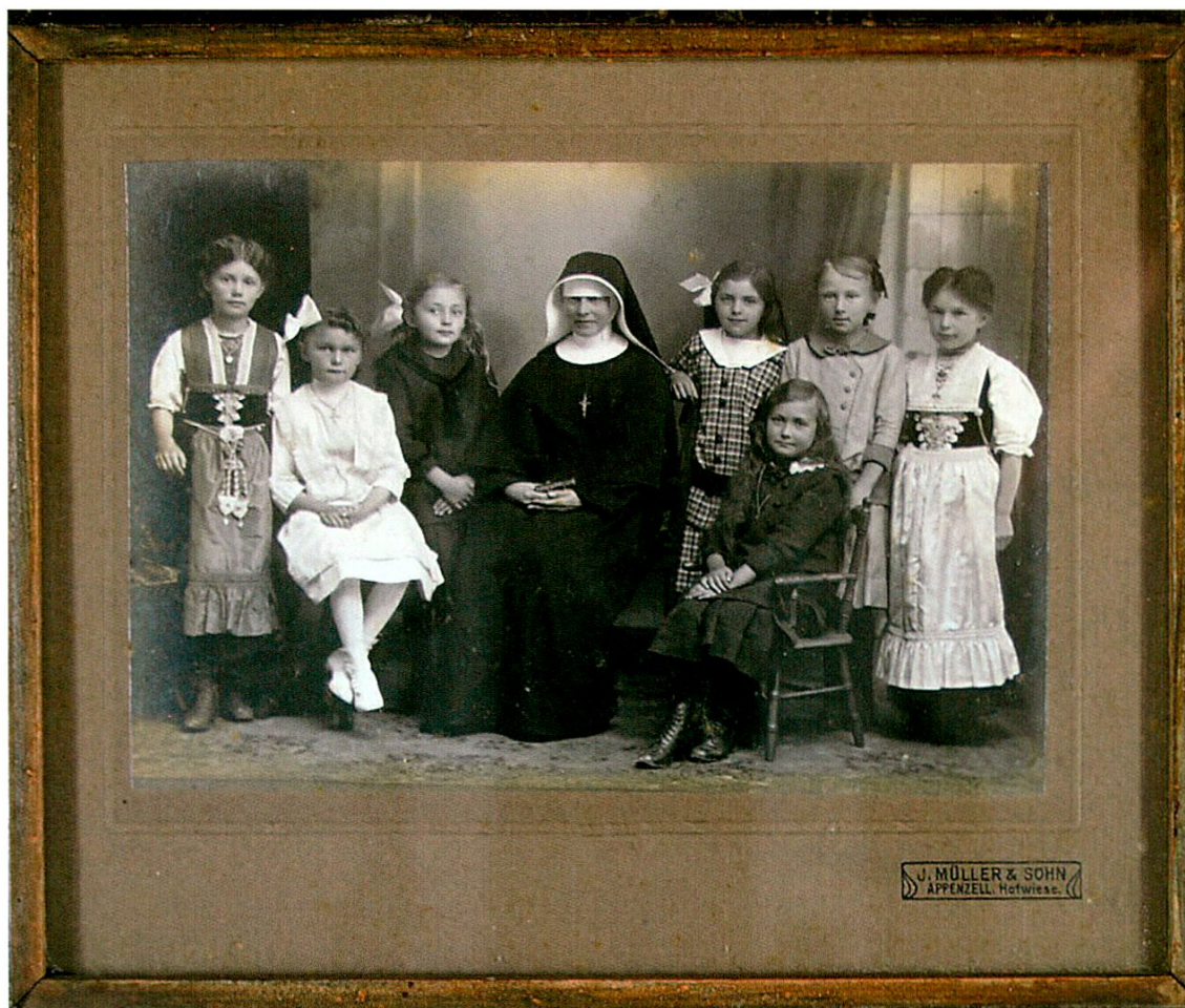
Gruppenbild mit Klosterfrau.

Alois Cariget: Kabinettscheibe «Der Stand Graubünden», 1951