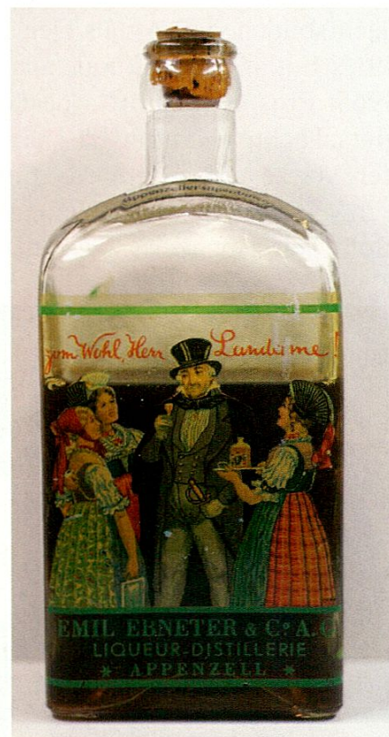
Liqueur-Flasche der Firma Emil Ebnetter & Co AG

Huber Blanche, Appenzell Sammlung von Stereofotos mit Sichtgerät; Kohlebügeleisen; 3 Fotos «Schiffli», Appenzell; alte Fotos von Frauen und Männern in Tracht; Anleitung «Bemerkung über misslungene Negative»