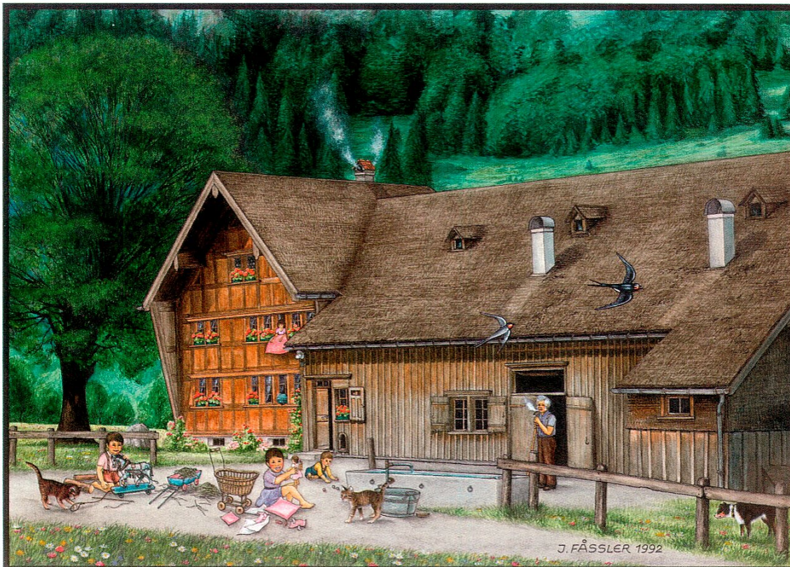
Josef Fässler, Genglis Sepp: D Bascheheemed, 1992, transparente Wasserfarbe, Tusche und Farbstift auf Papier.

Die Bilder von Josef Fässler unterscheiden sich nicht nur wegen der unüblichen Motivauswahl von der herkömmlichen Bauernmalerei; sie sind auch in einer ganz anderen Maltechnik ausgeführt. So verwendet Fässler fast immer Tusche in Verbindung mit transparenter Wasserfarbe, Bleistift und Farbstiften, wobei ihm