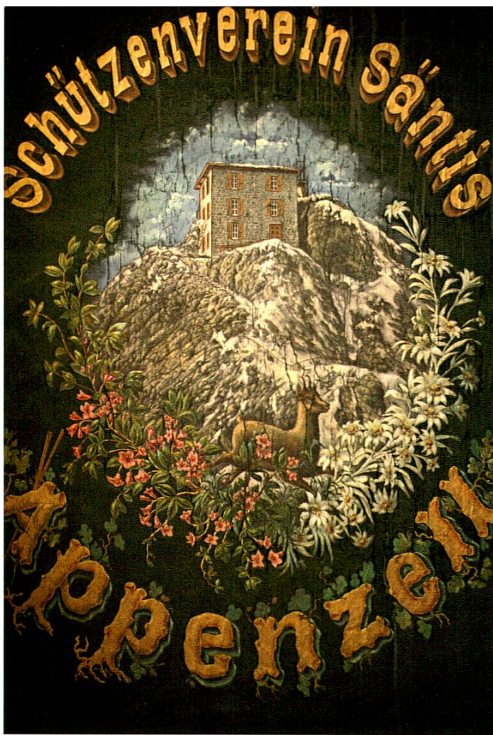
Ausschnitt aus der (Sämtis-)Fahne des Schützenvereins Sämtis, Appenzell.

Beide Fahnen sind aus Seide gearbeitet und mit Fransen umrandet. Die Buchstaben sind vergoldet, und die mit Ölfarben gemalten Sujets zeigen passende Motive, die auf die Aktivitäten des Vereins verweisen. Bei der ausgestellten Schützenfahne sind die Gewehre umrandet von Eichen- und Lorbeerlaub. Arbeiterfahnen sind meistens in rot gehalten und zeigen mit Vorliebe sich verbindende Hände oder Werkzeuge. Beide Fahnen präsentieren zudem den Appenzeller Bär umrandet von Alpenblumen.