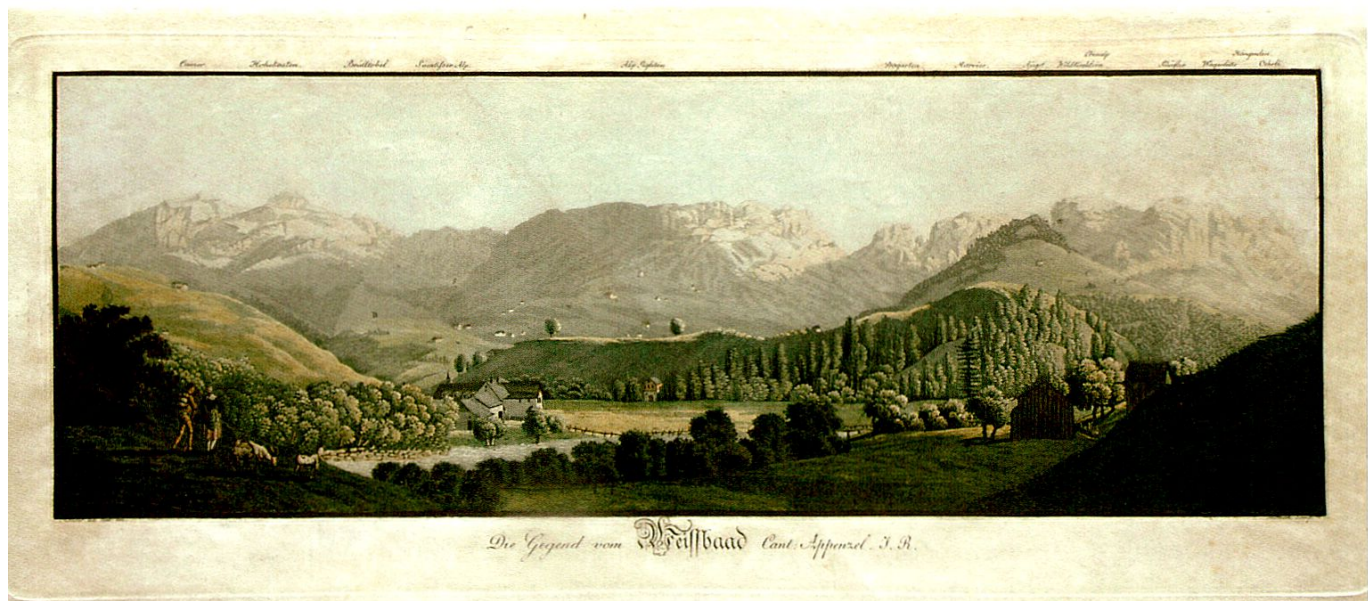
Heinrich Thomann: Die Gegend vom Weissbaad Cant. Appenzel J.R., um 1790, Aquatintaradierung.