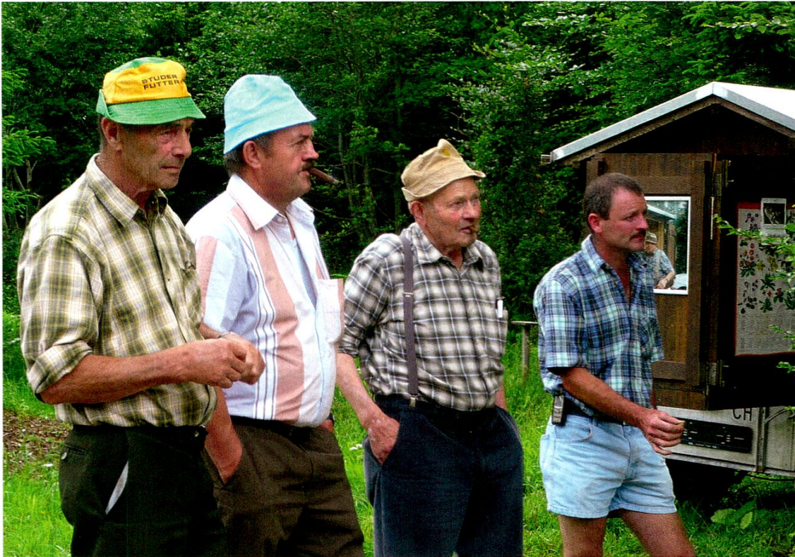
Imker mit Stumpen bei der Belegstation im Potersalper Herz.