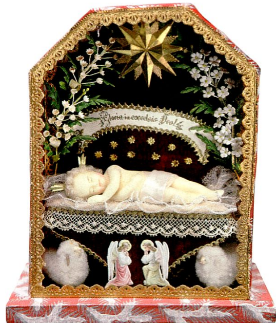
Links: Blick in die Forscherecke der Bienenausstellung. Rechts: Jesuskind (Fatschenkind) aus Bienenwachs.