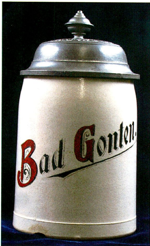
Bierhumpen, «Bad Gonten».