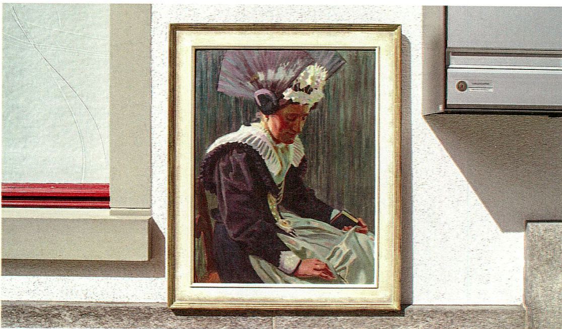
Hans Caspar Ulrich (1880–1950), Appenzeller Braut in schwarzer Festtagstracht, um 1920, Öl auf Leinwand.

Hans Caspar Ulrich (1880–1950): Appenzeller Braut in schwarzer Festtagstracht, um 1920, Öl auf Leinwand