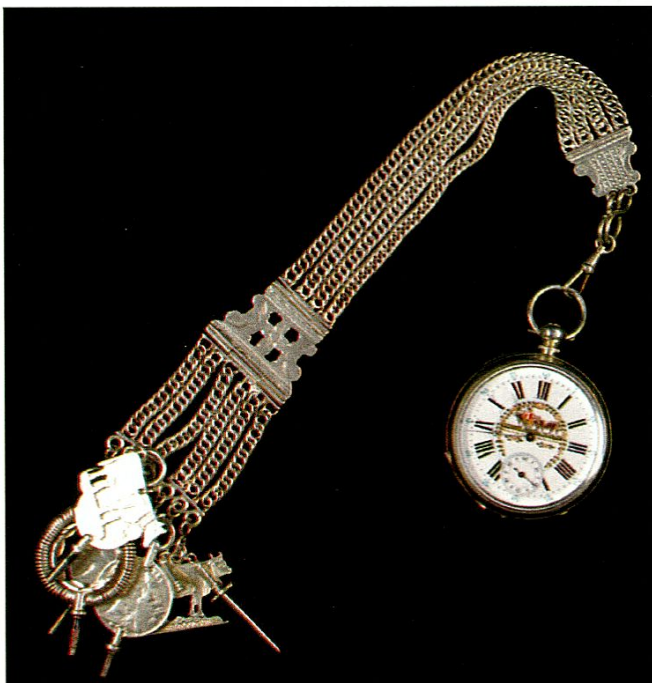
Sennenuhr um 1880.