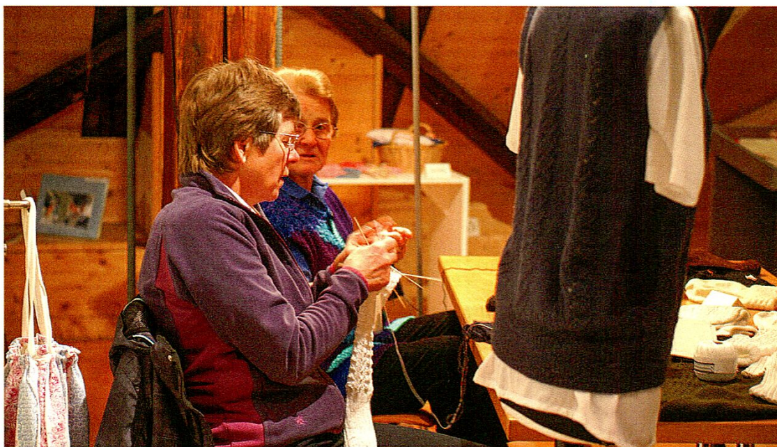
Blick in die Begleitveranstaltung «Gestrickte Lieblingsstücke» zur Sonderausstellung «Lismede».

Nachzutragen ist die erfolgreiche Durchführung der Begleitveranstaltung «Gestrickte Lieblingsstücke» zur Ausstellung «Lismede» am 22. Januar. Rund 20 Strickerinnen verwandelten den Stickereisaal in einen Stricksaal. Die Frauen zeigten Appenzeller Zipfelmützen und Trachtensocken, diverse Accessoires, Pullis und Babysachen sowie Kunststrickereien. Eine Gruppe von Schülerinnen bot zusammen mit ihrer Handarbeitslehrerin Einblick in eine Handarbeitsstunde. Musikalisch begleitet wurde der Anlass vom Zithertrio «Appenzell». Im «Sonngarten» waren Baumstämme zu bewundern, welche Handarbeitslehrerinnen zusammen mit ihren Schülerinnen und Schülern «umstrickt» hatten. Rund 140 Besucherinnen und Besucher nahmen am Anlass teil.