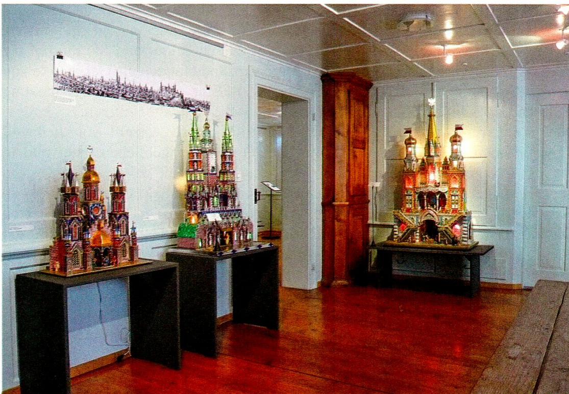
Blick in die Ausstellung Krakauer Krippen.

Als Höhepunkt im Berichtsjahr darf die Ausstellung «Krakauer Krippen. Weihnachtsglanz aus Polen» bezeichnet werden. In Zusammenarbeit mit dem Historischen Museum der Stadt Krakau und der Polnischen Botschaft in Bern konnten zwanzig hochkarätige Krippen und eine grosse Anzahl von historischen und aktuellen Fotos der Krakauer Krippentradition beziehungsweise des alljährlich stattfindenden Krippenwettbewerbs gezeigt werden. Die grösste Krippe mit einer Höhe von über zwei Metern war gleichzeitig das Aushängeschild der Ausstellung. Bereits die Vernissage war sehr gut besucht und hatte sich mit der Folkloregruppe «Piast» zu einem kleinen polnischen Volksfest entwickelt. Die insgesamt sechs öffentlichen Führungen waren allesamt mit zum Teil über 80 Besucherinnen und Besuchern pro Führung sehr gut besucht. Mitverantwortlich für den grossen Besucheraufmarsch war sicher auch die Berichterstattung der Tagesschau des Schweizer Fernsehens in der Hauptausgabe vom 24. Dezember. Auch zahlreiche Schulklassen aus Appenzell Innerrhoden haben die Ausstellung (in der Regel ausserhalb der Öffnungszeiten) besucht. In die Krippenausstellung integriert werden konnte die dreiteilige Videoarbeit «Nicht nur zur Weihnachtszeit» der aus Zakopane (Polen) stammenden Künstlerin Aleksandra Signer, die in St. Gallen wohnt. Leider wurden beim Rücktransport der Krippen nach Polen einige Exemplare aus unerklärlichen Gründen stark beschädigt.