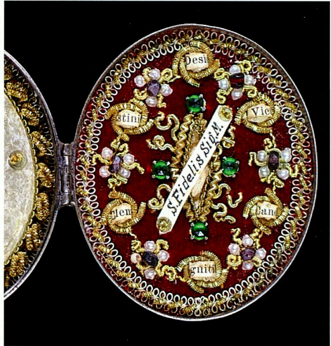
Reliquienkapsel aus Metall.

Auch die Ausstellung «Kostbarkeiten aus dem Kapuzinerkloster Appenzell», die aus Anlass der Schliessung des Klosters am 31. August 2011 realisiert worden war, fand viel Beachtung. Gezeigt wurde eine Reihe von kulturhistorisch bedeutenden Kunstwerken (Messgewänder, Goldschmiedearbeiten, Reliquien, Bilder, Skulpturen u.a). «Kostbar» ist nicht zwingend gleichbedeutend mit «materiell wertvoll», denn ein Kapuzinerkloster, das dem franziskanischen Armutsideal verpflichtet ist, darf kein Ort der Kirchenpracht sein. Ein Kulturgüterinventar des Klosters,