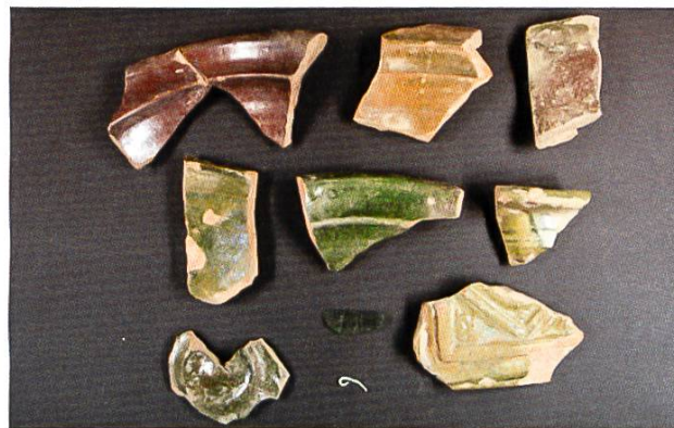
Appenzell, Oberer Gansbach: Funde aus dem Brandschutt des Appenzeller Dorf- brandes von 1560. (Abb. 4)

Datierung: Spätmittelalter; Frühe Neuzeit Adalbert Fässler, Grabungstechniker