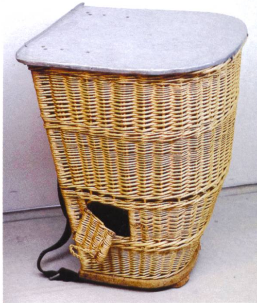
Metzgerchreeze von «Gemsli-Bisch».