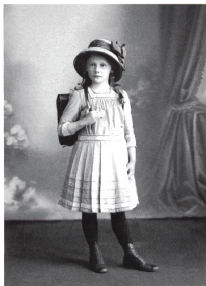
Jakob Müller: Mädchen mit Tornister, um 1915.

Die Sonderausstellung «tragen und transportieren» erweckte schon vor der Realisierung das Interesse verschiedener Besucherinnen und Besucher und hatte zur Folge, dass dem Museum u.a. zwei volkskundlich wertvolle Saumsättel und eine grosse Metzger-Zaine, mit welcher man Fett-Abfälle von geschlachteten Tieren per Bahn transportierte, geschenkt wurden.