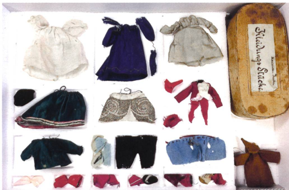
Kostüme des Marionettentheaters von Victor Tobler museumsgerecht aufbewahrt.

Nach der erfolgreichen Restaurierung des kulturhistorisch bedeutenden Marionettentheaters von Victor Tobler im Jahre 2015 galt es im Berichtsjahr, die Einzelteile zu fotografieren und konservatorisch einwandfrei abzulegen. Insgesamt handelt es sich um 150 Nummern. Diese setzen sich zusammen aus Kostümen, Kulissen, Möbeln, Plakaten, technischen und anderen Skizzen, Texten, Regieanweisungen, Notizzetteln u.v.a.m. Im Jahre 2017 soll das Marionettentheater von Victor Tobler in der Dauerausstellung einen neuen Platz bekommen, nachdem das Victor-Tobler-Zimmer 2014 dem künstlerischen Nachlass von Sibylle Neff weichen musste.