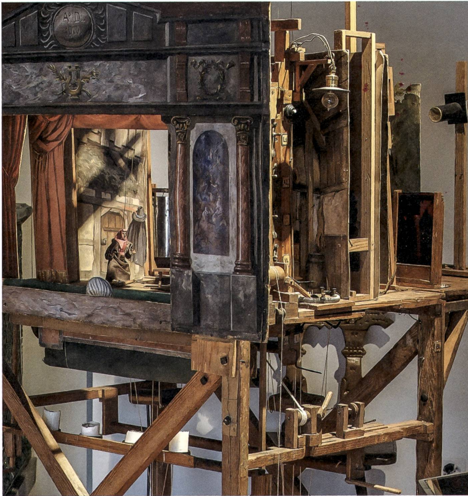
Das Marionetten- theater von Victor Tobler mit seiner ausgefeilten Bühnen- mechanik, 1900.

einen Wasserschaden. Die verschiedenen Bestandteile wurden in der Folge restauriert und erstrahlen heute in neuem Glanz. Im 5. OG (religiöse Volkskunst) wurden eine neue LED-Beleuchtung eingebaut und die Fenster mit UV-Folien beschichtet. In diesem Raum soll 2018 die Ausstellung «Religiöse Volkskunst» (Rebretter, Totengedenktafeln, Versehgarnituren, Votiv- und Andachtsbilder u.a.) neu gestaltet werden.