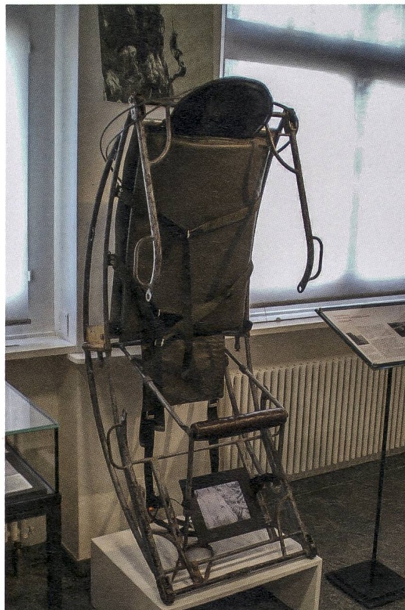
Rettungssitz für die Stahlseilrettung, um 1950.

Schulhäuser im Gringel durfte das Museum ein Alpsteinrelief sowie nicht mehr gebrauchtes Schulmobiliar entgegennehmen. Im Rahmen der Sonderausstellung «Kunstvolles aus Haar» fand das eine oder andere wertvolle Schmuckstück aus Haar Eingang in die Museumssammlung.