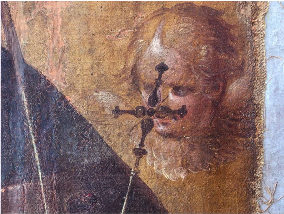
In dieser Detailaufnahme sind Graphitlinien in der letzten Schicht zu erkennen. (Abb. 14)

Effizienz und Effektivität. Denn Meuss hatte nicht mit dieser Nahsicht auf sein Gemälde gerechnet. Das Bild ist für die Betrachtung aus Distanz und den Blick von unten konzipiert. Deshalb konnte er auch Vages stehen lassen. Sein ganzer Übermut, die unterschiedlichen Tempi des Farbauftrags in seiner freien, suchenden Malweise werden nicht mehr ablesbar sein, wenn die Krönung Mariae auf über sechs Metern Höhe zurück im Hochaltar eingefügt ist. Umso mehr schätze ich mein Glück, dass dieses Bild über lange Zeit Teil meines Arbeitsalltags war und ich einem längst verstorbenen Kollegen nähergekommen bin.