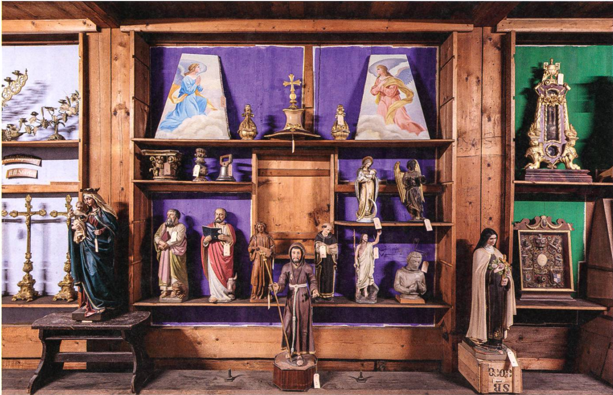
Das Schaulager beherbergt alle, wirklich alle Dinge, die im Sommer 2019 im Dachstock und in Nebengebäuden der Kirche auffindbar waren. (Abb. 1)

schmacks der Kirchgemeinde. Die schiere Menge an Gleichem oder Ähnlichem bezeugt die lebendige Dynamik im Umgang mit der Ausstattung von Kirchen und Kapellen.